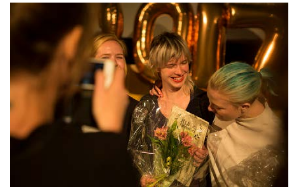
Kultur i Väst arrangerar Frame – en årlig kortfilmfestival, tävling och mötesplats.